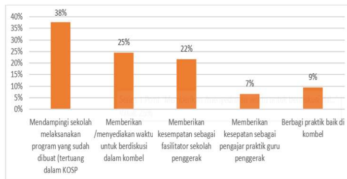
Gambar 3. Upaya Penguatan Peran Pengawas Sekolah dalam IKM

Gambar 3, dapat dijelaskan bahwa terdapat 38% responden menyatakan penguatan dilakukan melalui pendampingan sekolah dalam melaksanakan program yang sudah dibuat (tertuang dalam KOSP), 25% responden melalui menyediakan waktu untuk berdiskusi dalam komunitas belajar (Kombel), 22% responden menyatakan memberikan kesempatan sebagai fasilitator pada sekolah penggerak, 7% responden menyatakan memberikan kesempatan sebagai pengajar praktik baik dan 9% responden menyatakan berbagi praktik baik di dalam Kombel. Tabel 3 menggambarkan bahwa terdapat dua upaya penguatan peran pengawas sekolah yang menjadi pilihan utama responden, yakni upaya melibatkan pengawas sekolah dalam pendampingan di sekolah penggerak dan upaya melibatkan pengawas sekolah pada aktivitas Kombel di sekolah penggerak. Beberapa riset menggambarkan bahwa Kombel sangat strategis dan efektif dalam memberikan pemahaman kepada guru tentang Kurikulum Merdeka (Fitriana et al., 2022). Melalui kombel maka para guru saling berbagi good practise (praktik baik) dengan sesama guru lainnya. Langkah ini dipandang cukup efektif bagi guru dalam IKM (Meuthia, 2023). Selain pengawas, Kombel merupakan satu diantara variabel yang memengaruhi suksesnya IKM.